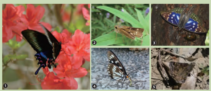
写真：減少傾向がみられた①ミヤマカラスアゲハ／②イチモンジセセリ ③オオムラサキ／④ゴマダラチョウ／⑤ミヤマセセリ